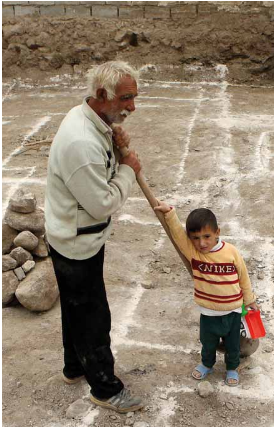
مدیر شعب بانک کشاورزی در استان آذربایجان شرقی خبر داد:

در سایه تلاش همکاران بانک، استاندار آذربایجان شرقی به‌طور جداگانه در سه مرحله از بانک کشاورزی در اجرای موفق قانون هفتمندی یارانه‌ها، عملکرد مطلوب در جذب اعتبارات ابلاغی بنگاه‌های اقتصادی زودبازده و کارآفرین و همچنین توزیع مناسب سهام عدالت تقدیر به عمل آورد. از این‌رو و به‌منظور ایجاد فضای مناسب کاری برای کارکنان و تکریم مشتریان در سال جاری، شعبه «نظرکهریزی» هم‌زمان با هفته دولت با هزینه‌ای بالغ بر هزار و ۱۲۰ میلیون ریال و شعبه خیابان فردوسی تبریز هم‌زمان با دهه فجر با هزینه بالغ بر ۶ میلیارد ریال احداث و به بهره‌برداری رسیدند. در همین راستا شعب تبریز، ترک، کاغذکنان،